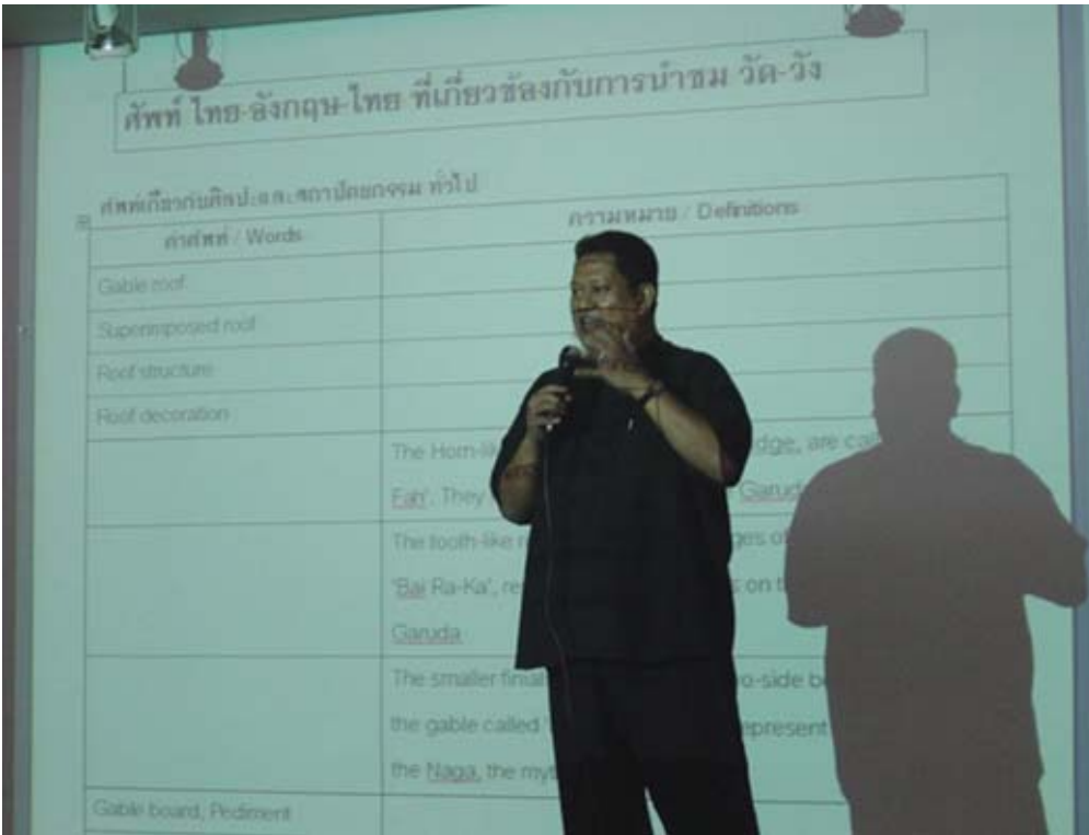
การเสวนาแลกเปลี่ยนหลักสูตรระหว่าง โรงเรียนที่เข้าร่วม โครงการวิจัย

แนวคิดเกี่ยวกับหลักสูตร ระหว่างผู้วิจัย ผู้ร่วมทำวิจัย และครูผู้สอนภาษาอังกฤษระดับมัธยมศึกษาในโรงเรียนที่ร่วมวิจัย จำนวน 1 ครั้ง เพื่อตกลงกรอบเนื้อหา แนวทางการจัดการเรียนรู้ สื่อประกอบการเรียน การวัด/การประเมิน ตัวชี้วัด