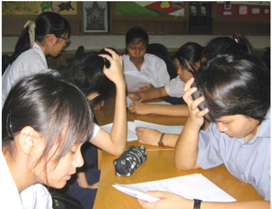
ในการพัฒนาหลักสูตรยังได้เปิดโอกาสให้เยาวชนได้แสดงความคิดเห็นถึงความเหมาะสมของหลักสูตร ว่ามีความเหมาะสมเพียงใด

1.7 จำนวนนักเรียนไม่ควรเกิน 20 คนต่อกลุ่ม