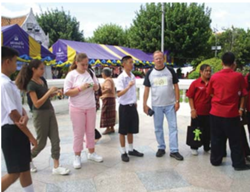
การทดลองหลักสูตรนอกพื้นที่ก่อให้เกิดการพัฒนาทักษะการสื่อสารได้อย่างมีประสิทธิภาพ

การวิจัยตอนนี้ผู้วิจัยได้มอบหมายให้อาจารย์ผู้สอนภาษาอังกฤษและ ผู้วิจัยร่วมตามโรงเรียนที่รับผิดชอบ ดำเนินการประชุมกลุ่มสนทนาภายในโรงเรียน ได้แก่ โรงเรียนมัธยมวัดเบญจมบพิตร โรงเรียนมัธยมวัดมกุฏกษัตริย์ โรงเรียนมัธยมวัดดุสิตดารา โรงเรียนศิลาจารย์พัฒนา โรงเรียนมัธยมสาธิตมหาวิทยาลัยราชภัฏสวนสุนันทา โรงเรียนวัดสังเวช และโรงเรียนโยธินบูรณะ โดยผลจากการวิจัย พบว่า โรงเรียนที่เข้าโครงการทั้ง 7 แห่งสามารถสร้างหลักสูตรภาษาอังกฤษเพื่อการท่องเที่ยวในท้องถิ่นได้ด้วยตนเอง ดังนี้