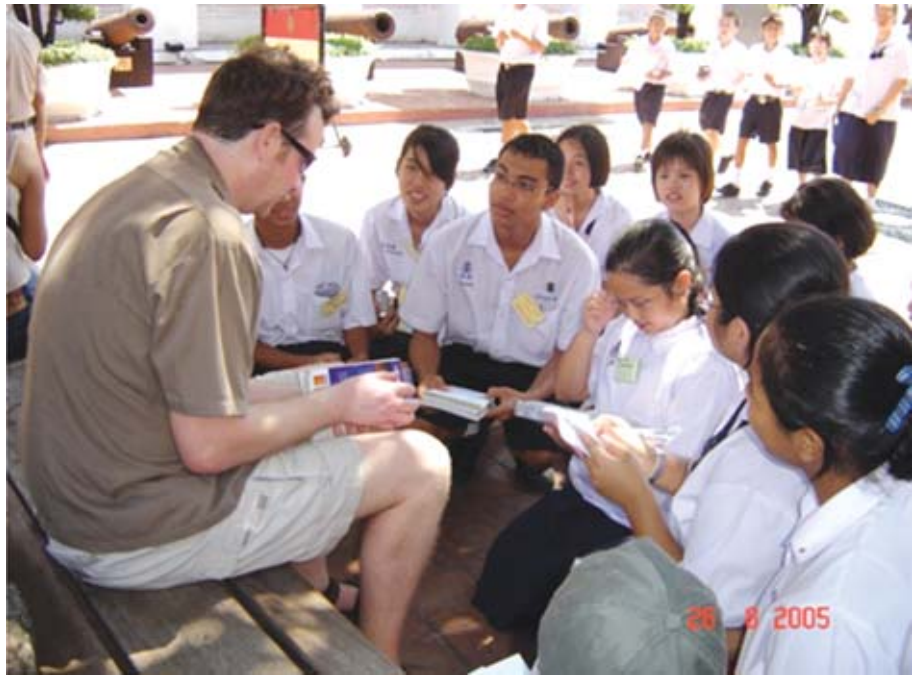
การส่งเสริมการเรียนรู้ภาษาอังกฤษเพื่อการท่องเที่ยว จะสร้างข้อได้เปรียบให้แก่นักเรียนในโรงเรียนที่เข้าร่วมโครงการ ในการสร้างโอกาสพัฒนาอาชีพ

การปฏิรูปการเรียนการสอนภาษาอังกฤษ และส่งเสริมการพัฒนาการท่องเที่ยวในท้องถิ่น จำเป็นอย่างยิ่งที่ต้องมีการพัฒนาครูภาษาอังกฤษของโรงเรียนในท้องถิ่น ให้สามารถพัฒนาหลักสูตร จัดกิจกรรม กระบวนการเรียนรู้ได้อย่างเหมาะสม สอดคล้องกับพื้นฐาน คุณลักษณะของผู้เรียนในท้องถิ่น พร้อมกับพัฒนาปัจจัยสนับสนุนการเรียนรู้ของครูและผู้เกี่ยวข้องในท้องถิ่น เช่น แหล่งเรียนรู้ เครือข่ายการเรียนรู้ ระบบที่ปรึกษา กลไกสนับสนุนต่างๆ โดยออกแบบกิจกรรม กระบวนการการเรียนรู้ให้มีส่วนส่งเสริมการพัฒนาการท่องเที่ยวของท้องถิ่นด้วยเพื่อให้กระบวนการนี้มี