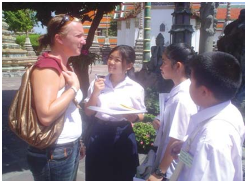
จากการทดลอง หลังการทำโครงการวิจัย พบว่าผลสัมฤทธิ์การเรียนสูงขึ้นจากเดิมในทุกๆ โรงเรียนที่เข้าร่วม

จากที่ทุกโรงเรียนได้นำหลักสูตรภาษาอังกฤษเพื่อการท่องเที่ยวไปใช้ในโรงเรียน ผลการทดลองใช้ปรากฏว่า ผลสัมฤทธิ์ทางการเรียนหลังเรียนสูงกว่าผลสัมฤทธิ์ทางการเรียนก่อนเรียน อย่างมีนัยสำคัญและเนื้อหาที่จัดเหมาะสมกับวัตถุประสงค์ที่วางไว้ อย่างไรก็ตามระยะเวลาเรียนที่กำหนดไว้ยังไม่เพียงพอ ควรได้ฝึกปฏิบัติจริงตามสถานการณ์จริงด้วย แต่ก็มีบทเรียนบางบทต้องใช้เวลาจัดกิจกรรมการเรียนรู้มากเกินไป มีบางโรงเรียนเกิดการเรียนรู้ร่วมกันและแลกเปลี่ยนประสบการณ์